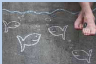
Neue Chancen für Schulverweigerer