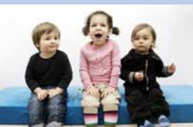
Spielend wieder fröhlich werden