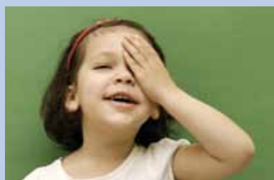
Benachteiligten Kindern Horizonte eröffnen